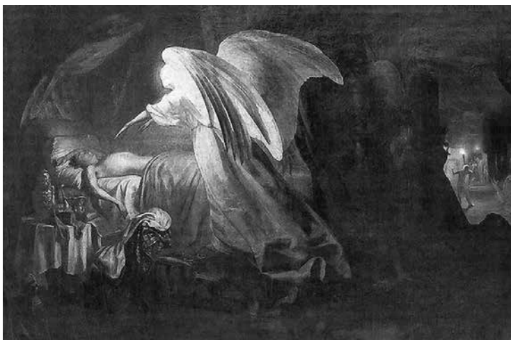
Ангел смерти истребляет первенцев египетских. Эскиз. 1865 г.

шое наказание для меня было бы, если бы меня перевели в вольнослушатели. Я побаивался даже идти к инспектору и откладывал.