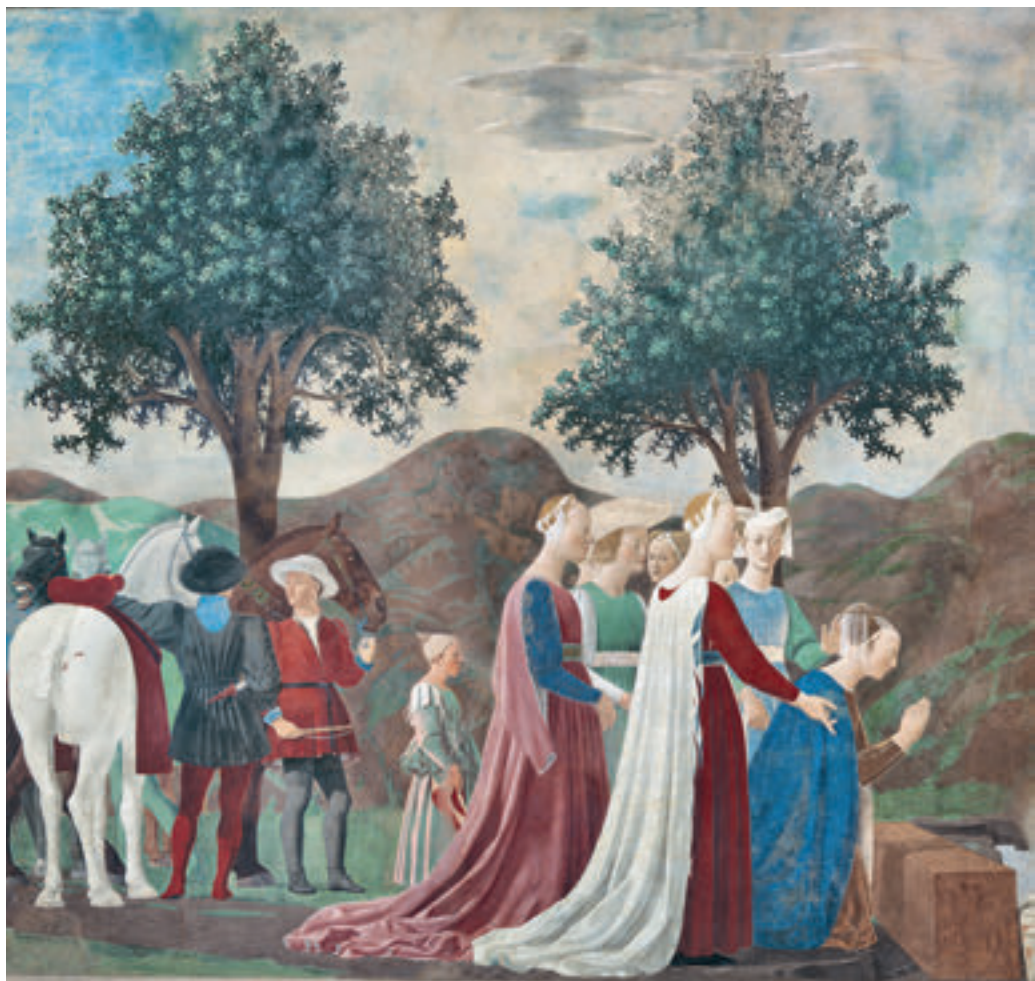
Пьеро делла Франческа, Встреча Соломона и царицы Савской , Ареццо, базилика Сан Франческо