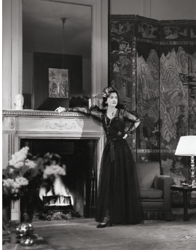
Коко Шанель в своих апартаментах в отеле «Риц».

С этого момента и до последнего дня она — деловая женщина. Всю жизнь она будет трудиться без устали, следуя своему двойному призванию: создавать новые модели одежды и управлять предприятием, будет предлагать все более и более многочисленным клиенткам собственную версию того, как надо одеваться, бросит вызов ведущему стилисту того времени Полю Пуаре, постепенно, одну за другой, отбивая у него клиенток и расширяя таким образом круг сторонниц, которые по ее призыву навсегда откажутся от эгреток, причесок из длинных волос и сужающихся книзу юбок.