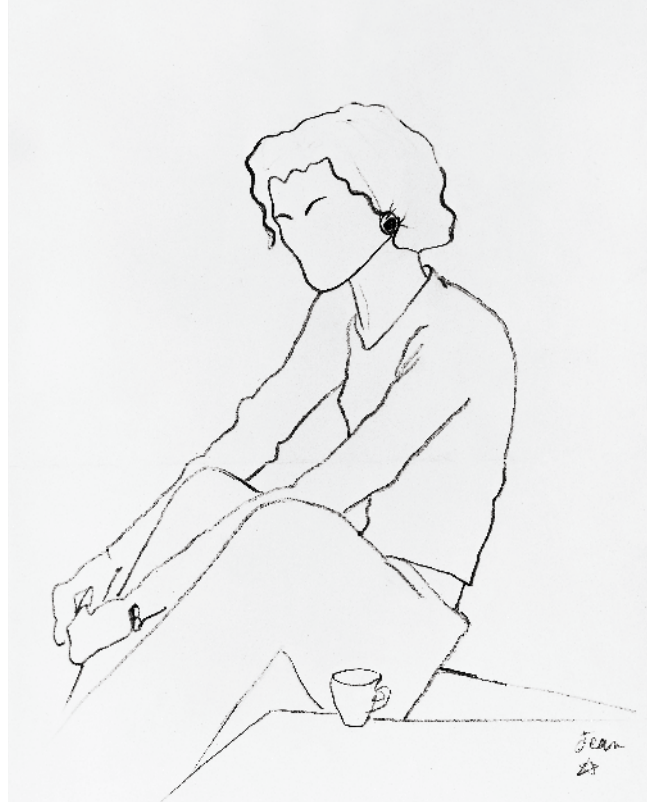
Портрет Шанель. Рисунок Кокто.

башмаках. Вполне вероятно, ее тогдашний гардероб был скромным, однако известно, что в Париже она появилась одетая уже по своему собственному вкусу, то есть непохожая ни на кого, и в ней угадывалось то скрытое пламя, которое позже заставляло всех, встречавшихся с этой женщиной, запомнить ее навсегда.