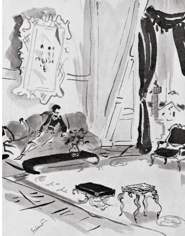
Мадемуазель Шанель в своих апартаментах в «Рице». Рисунок Кристиана Берара.